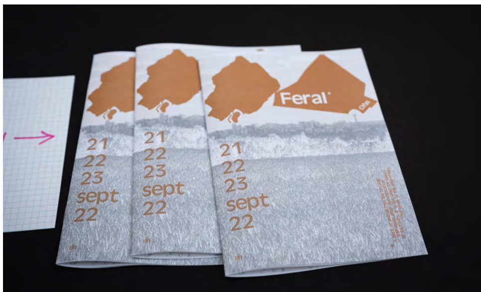
Les programmes de Feral réalisés par Théodora Jacobs

Notre comptabilité est gérée par Art Consult / Deg&Partners et notre secrétariat social est confié à Salary Solutions .