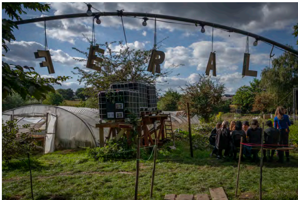
Feral , septembre 2022