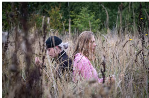
Feral 2022, septembre 2022