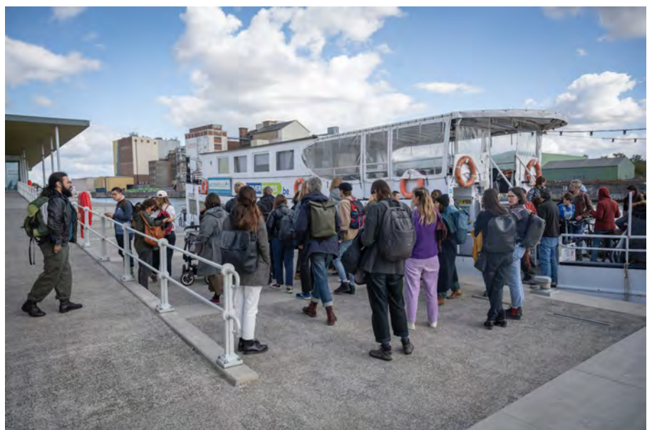
Feral 2022, septembre 2022

Ainsi, le Cifas est très porté vers l'international, la circulation des artistes, la prise en compte des modes de production de plus en plus transnationaux. L'usage de différentes langues au cours des workshops en témoigne. Le Cifas contribue également à conforter Bruxelles dans sa position de plateforme artistique cosmopolite.