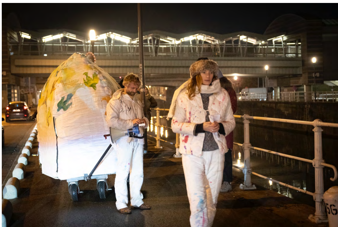
Lanterne férale, sur les bords du Canal en direction d'Anderlecht, décembre 2022

Le troisième et dernier jour de Feral a eu lieu dans le champ de Open Akker sur la commune de Dilbeek. Nous nous y sommes rendu-es de manière groupée en bus ou à vélo depuis la Gare du Midi jusqu'au champ où le collectif d'artistes nous a accueilli-es pour une après-midi artistique et participative.