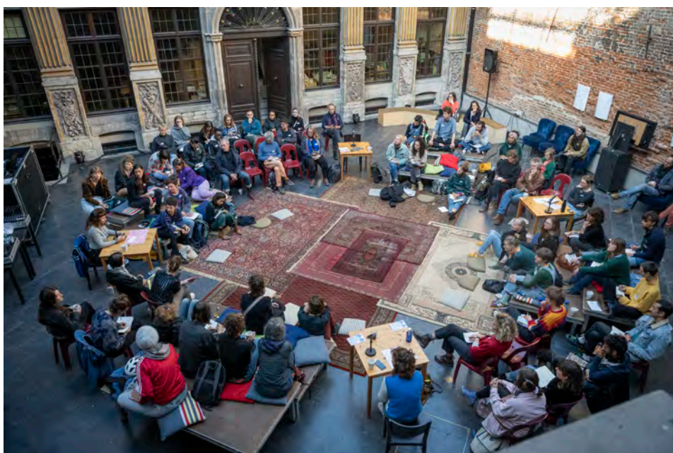
FERAL, septembre 2022