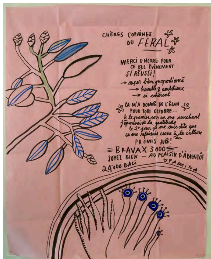
Mot envoyé après Feral par Pamina de Coulon