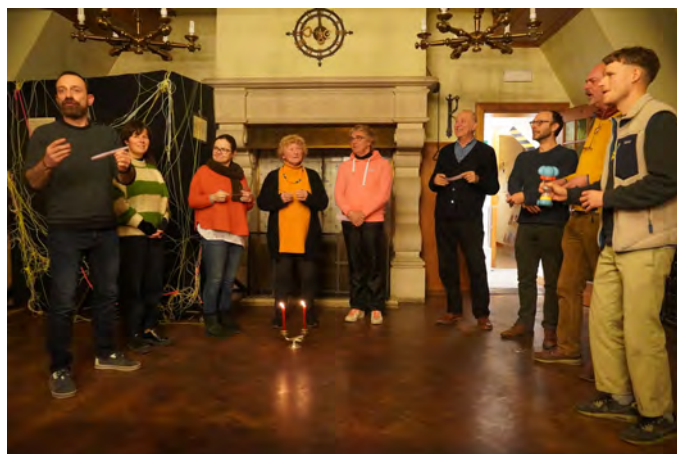
Groupes de réflexion, décembre 2022

A la fin des trois sessions, le groupe s'est mis d'accord sur la thématique « la super fête super multiculturelle » qui sera transmise le premier jour de la résidence à l'artiste, l'élue politique et l'habitante qui exploreront à leur tour Anderlecht pendant sept jours, avec cette thématique comme toile de fond, afin de penser et proposer l'esquisse d'une œuvre artistique dans l'espace public.