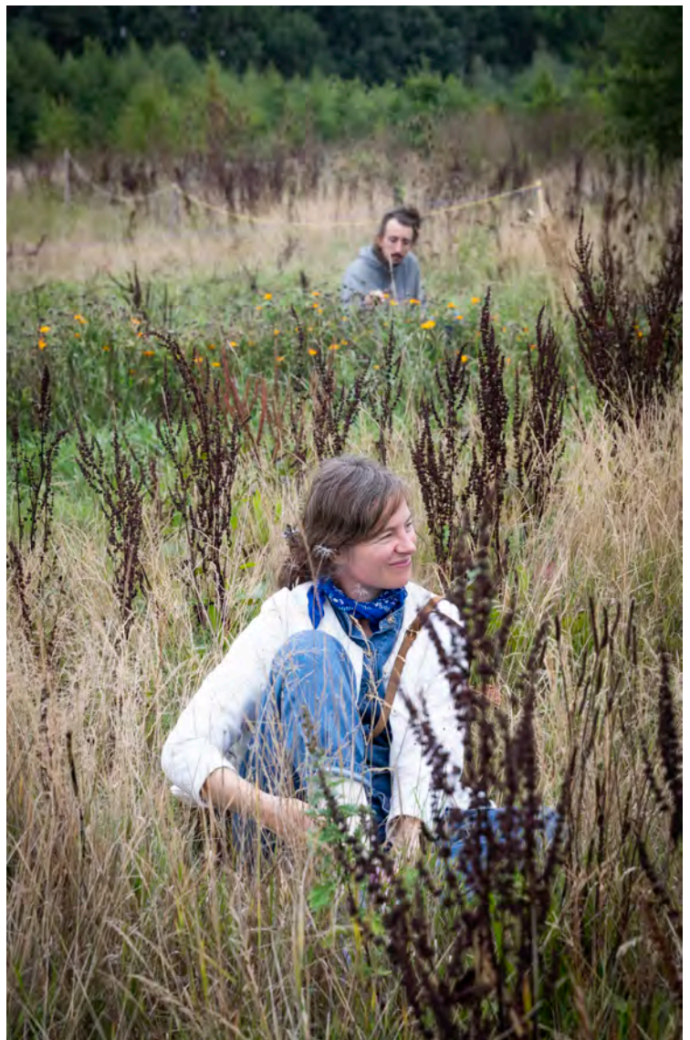
OpenAkker, FERAL, septembre 2022

Ce fut une journée de totale immersion et de radicale expérimentation qui résonnait avec tout le savoir et les expériences partagés des deux précédentes journées.