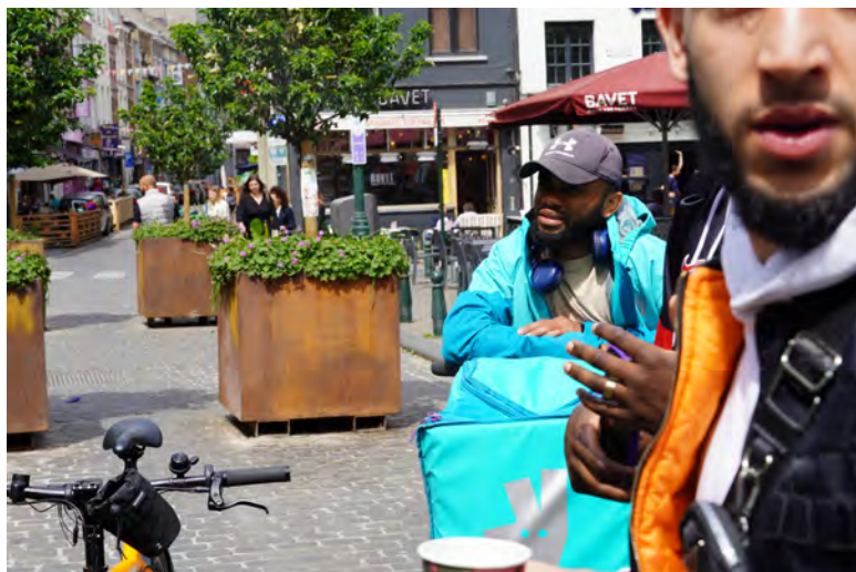
Delivery, mars 2022 (c) Cifas