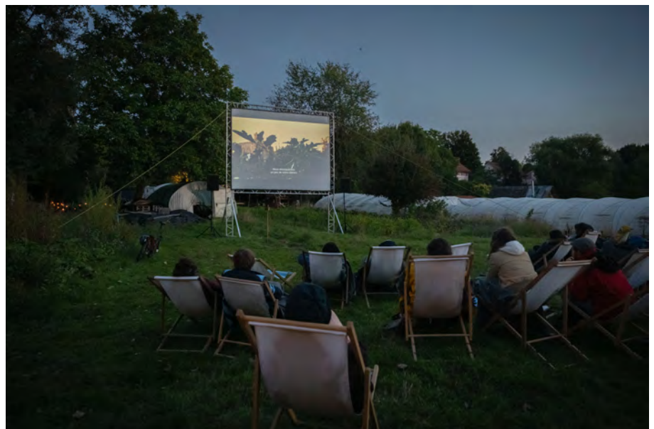
FERAL, septembre 2022

Le film suit la mise en place d'un moulin communautaire et les différentes étapes de cette initiative collective avec ses rencontres, ses doutes, ses moments de joie. Un groupe de trentenaires rejette l'émigration comme seule réponse possible aux problèmes économiques, écologiques sociales et politiques qui affligent leur territoire. Alors ils décident de rester et de lier leur vie à la terre, même s'ils n'en possèdent pas. Agriculture, utopie, communauté : la Casa delle Agricolture dont le documentaire se relate l'initiative, est née en 2013 dans les Pouilles, associant démarche agricole, justice sociale, et reconsidération des communs. www.casadelleagricolturetulliaegino.com