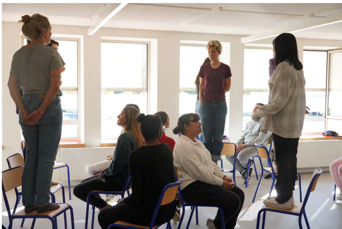
School of love, octobre 2022