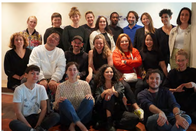
Producers' Academy, mai 2022