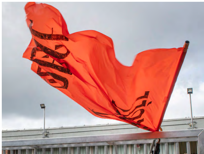
Fusée de détresse

Fusée de détresse est un projet européen qui se base sur les lettres rassemblées dans l'Encyclopédie des migrant-es. Le CIFAS est partenaire de ce projet de coopération européenne qui se déploie entre 2019 et 2022 en France, Belgique, Portugal, Espagne, Italie et Turquie. Le CIFAS a présenté la première phase du projet à Bruxelles dans le cadre de SIGNAL le vendredi 27 septembre 2019. Le projet se poursuit en 2020, en 2021 et s'est achevé cette année.