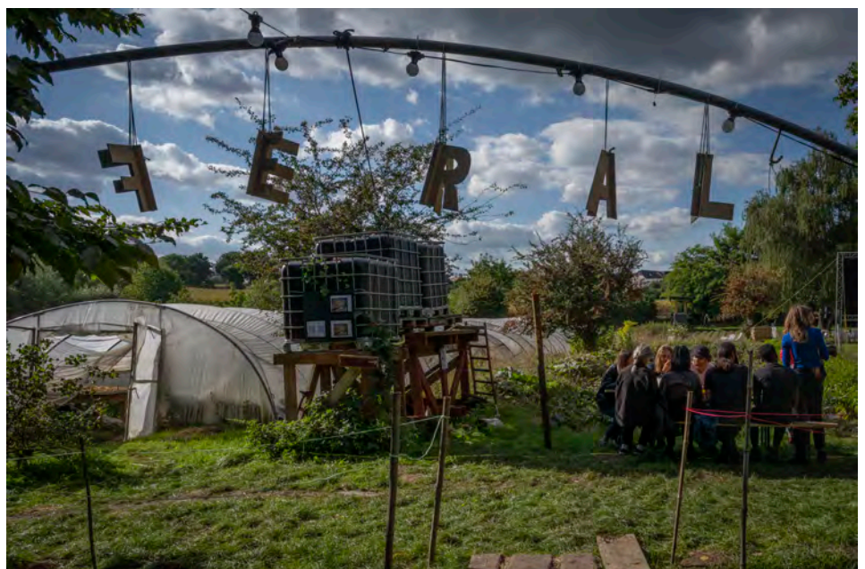
Feral, septembre 2022

Jour #3 - 23/09 : au champ pour l'équinoxe ( Open Akker , Dilbeek)