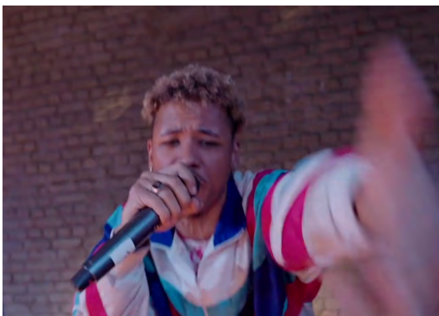
Delivery, Mai 2022