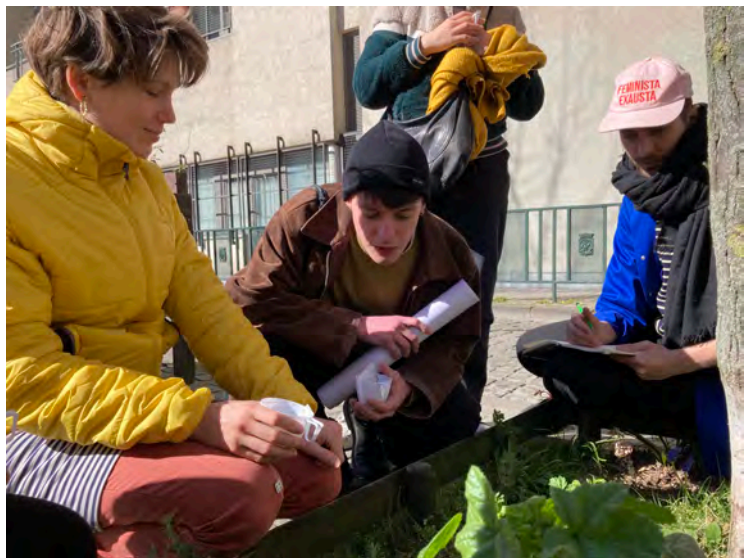
Constellations, mars 2022

Constellations est un nouvel outil pour apprendre de nouvelles méthodologies, pour comprendre d'autres chemins d'écriture, pour connaître d'autres façons de faire et pour renforcer la solidarité artistique.