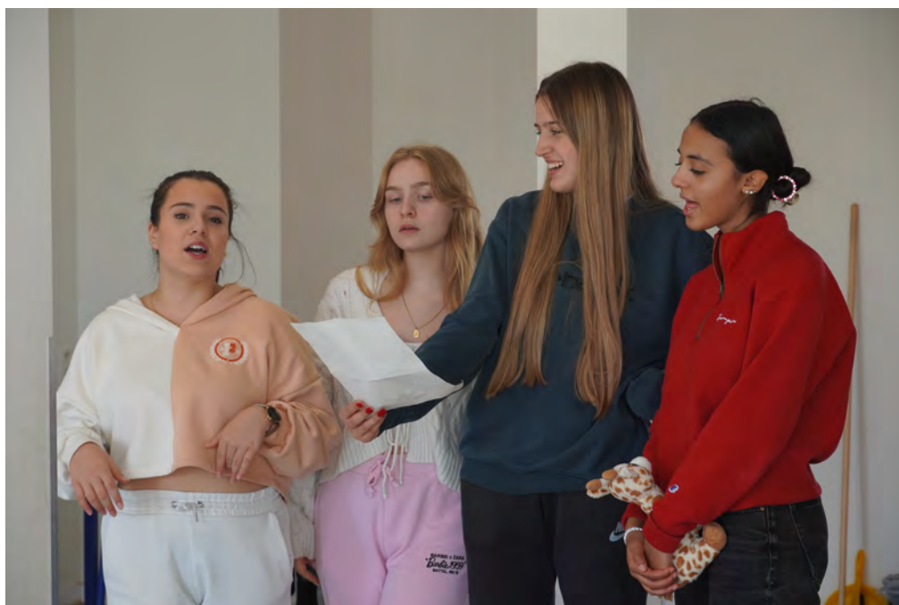
School of love, octobre 2022