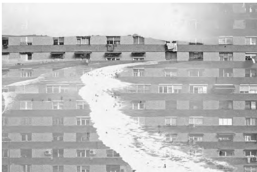
Résidence secondaire