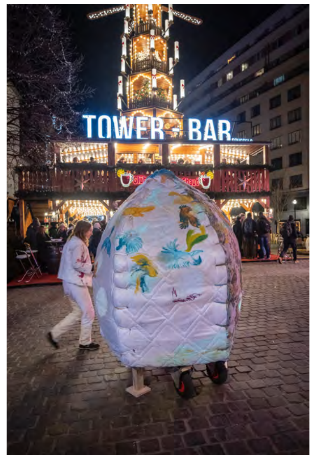
Lanterne férale, décembre 2022

Cette commande artistique répond à un désir de poétisation de la ville, et de réappropriation de l'espace public lors de la période intense de consommation massive autour de Noël.