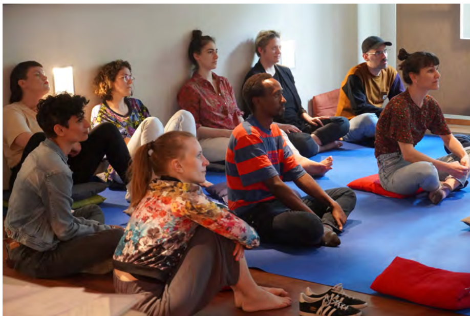
Producers' Academy, mai 2022

La Producers' Academy est un programme composé de workshops, discussions, rencontres, réflexions et partages d'expériences sur la production et la diffusion à l'international, prenant place en mai, en marge du Kunstenfestivaldesarts.