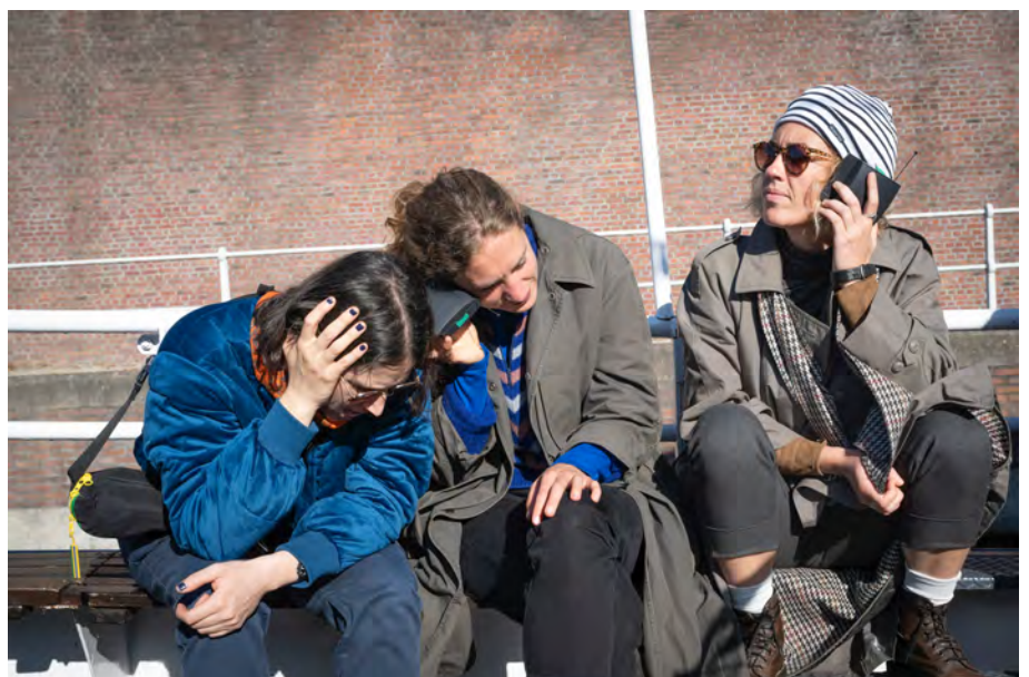
FERAL, septembre 2022

Zoë a proposé un rituel qui se terminera par un grand compostage et par un joyeux partage de mocktails botaniques faits maison. Nous avons levé nos verres à la terre, aux un-es et aux autres, à nos actes collectifs. www.zoelaureenpalmer.com