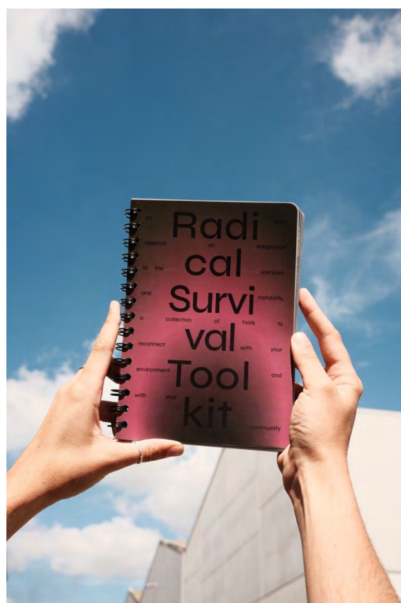
Radical Survival Toolkit par MOSSS