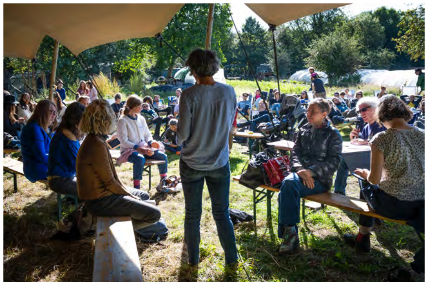
FERAL, septembre 2022