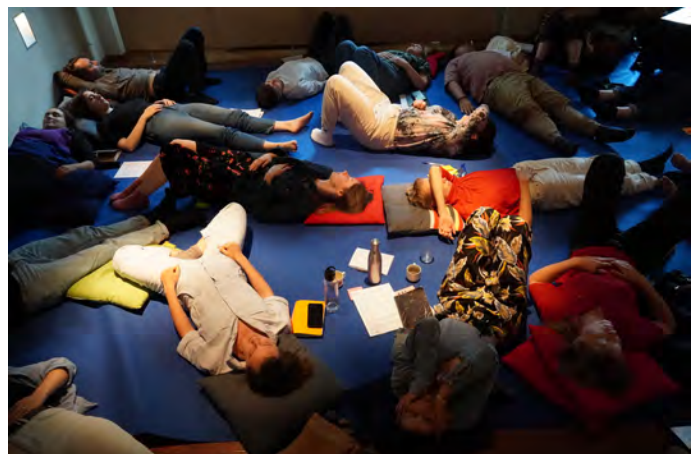
Producers' Academy, mai 2022

A theatre play about Mahoor, a 16-year-old girl who just moved to Tehran in the middle of the semester, and who forms a deep and intimate friendship with the best student of the class.